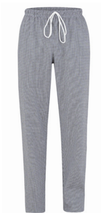
Q32 - Quadro nero